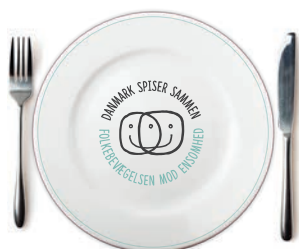
Logo med visual