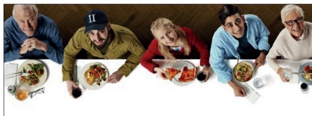
Bord og gæster visual i forskellige versioner